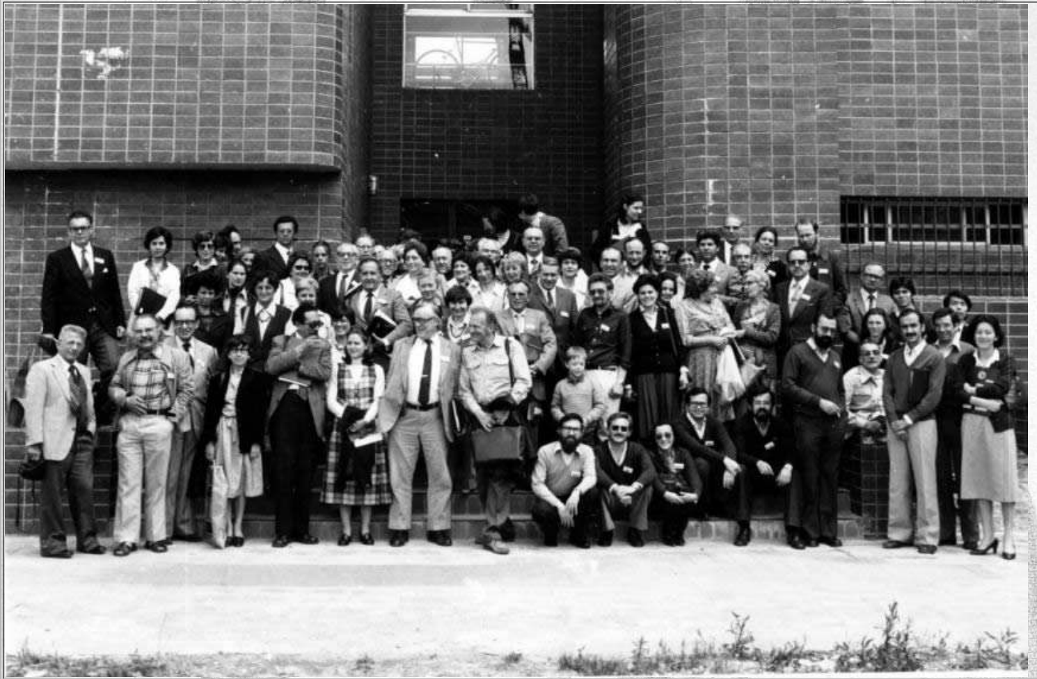
Photo de groupe prise lors du congrès de Séville en 1980